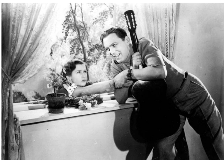
Aleksander Żabczyński w filmie Zapomniana melodia