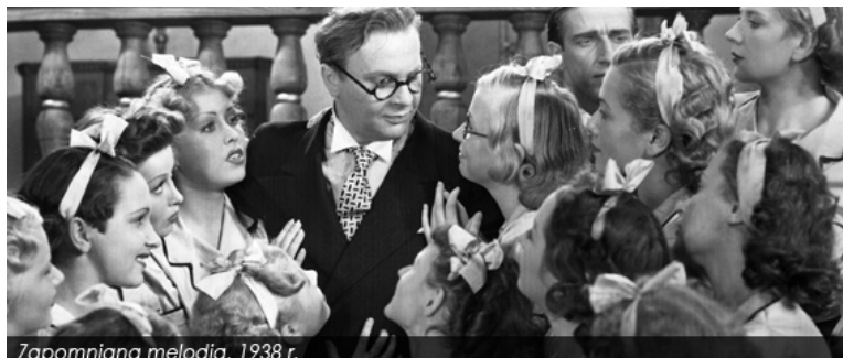
Zapomniana melodia, 1938 r.

emisja: niedziela, 4 kwietnia, godz. 18.20